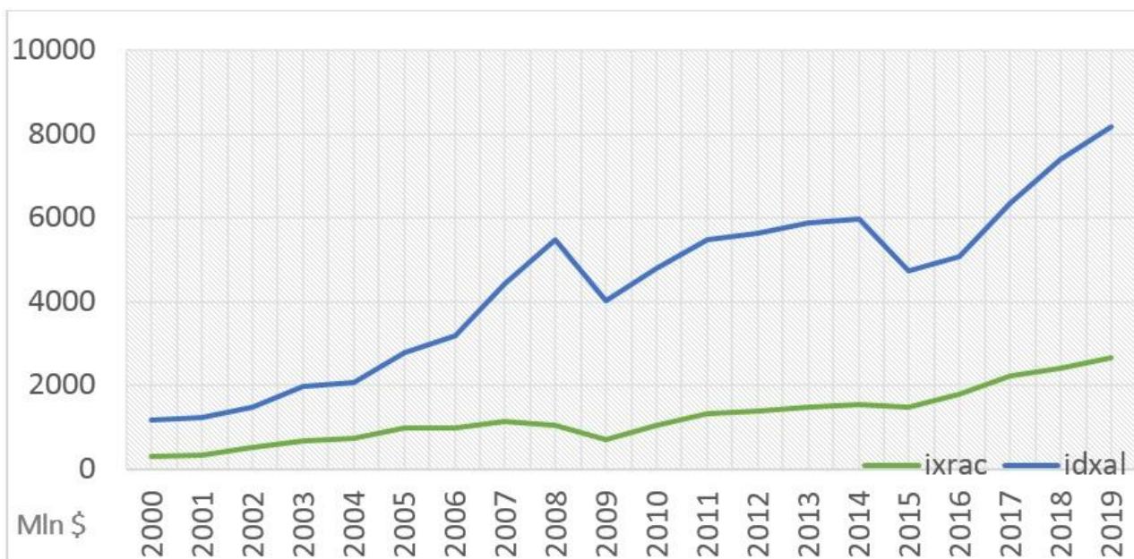
Qrafik1: Ermənistan Respublikasının 2000-2019-ci illər ərzində idxal-ixrac əməliyyatları